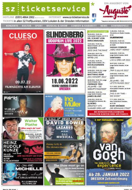
Beispiel für unsere Ticketseite in der Zeitung

Jeden Dienstag und Freitag (kann variieren) erscheint unsere Ticketseite in der Gesamtausgabe der Sächsischen Zeitung und immer dienstags in der Dresden Morgenpost.